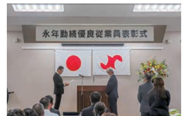
第65回 永年勤続優良従業員表彰式

今回で、66回の開催を迎え、これまで多くの従業員の方が表彰されております。ぜひ、貴事業所の従業員・職員を被表彰者としてご推薦くださいますようお願い申し上げます。